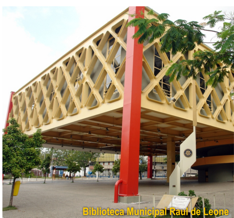
Biblioteca Municipal Raul de Leone