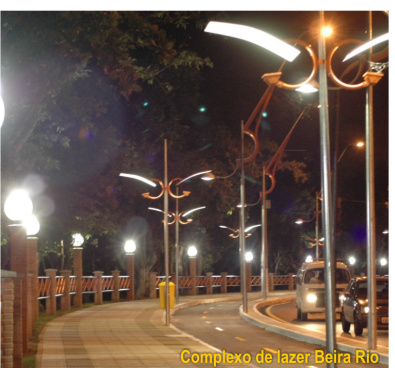
Complexo de lazer Beira Rio