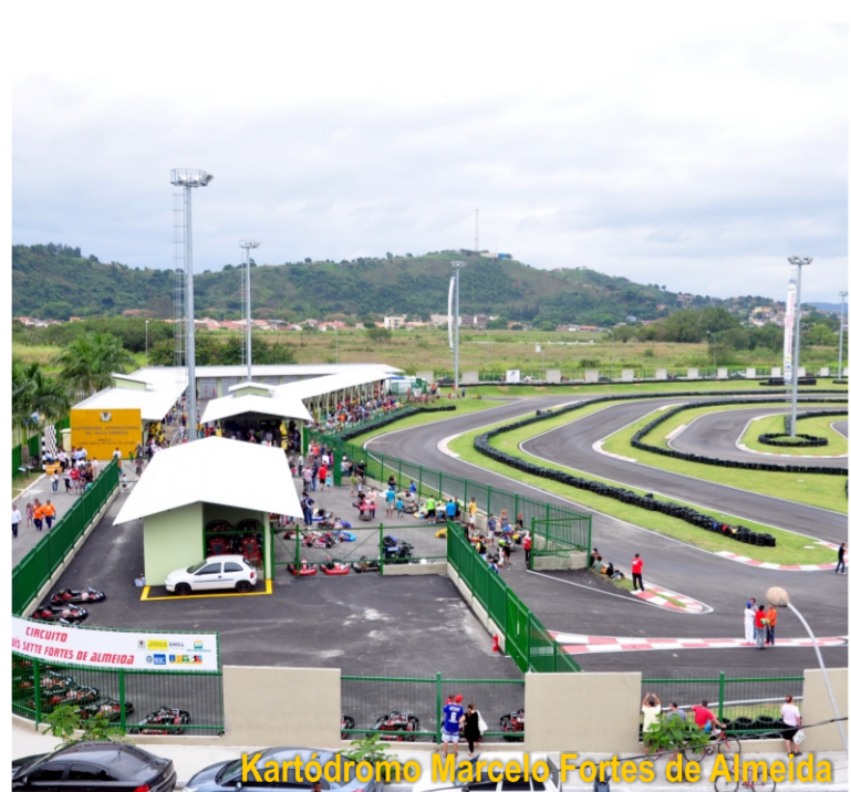
Kartódromo Marcelo Fernandes de Almeida