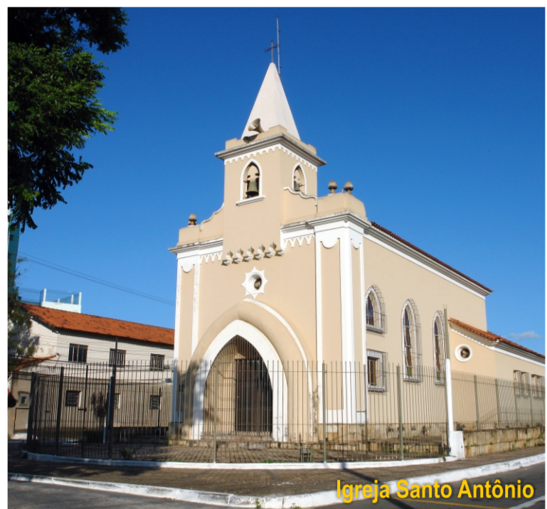
Igreja Santo Antônio