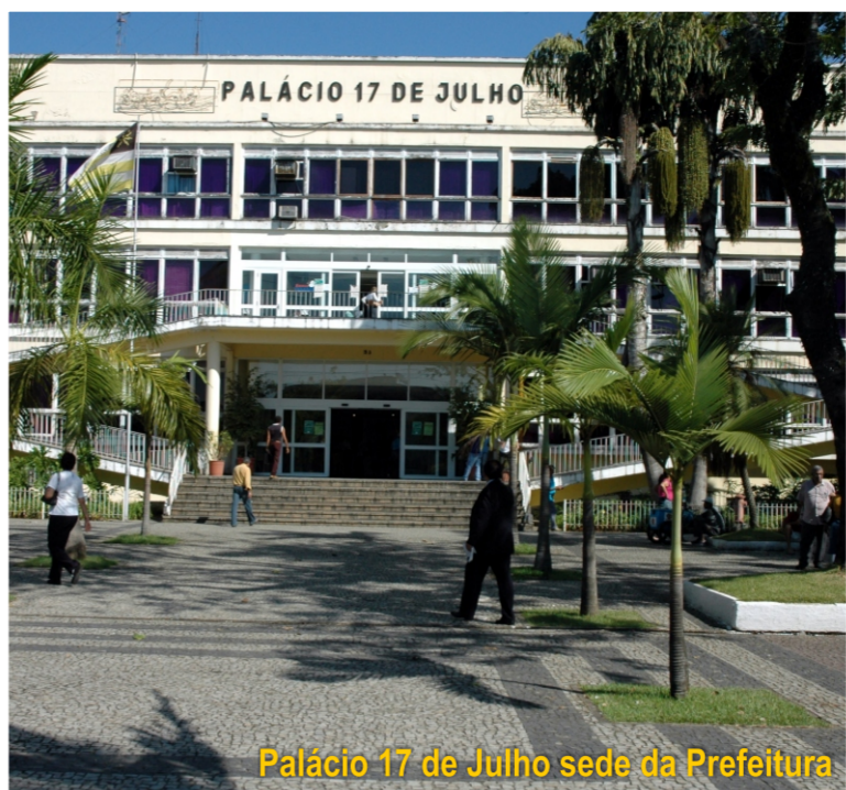
Palácio 17 de Julho sede da Prefeitura