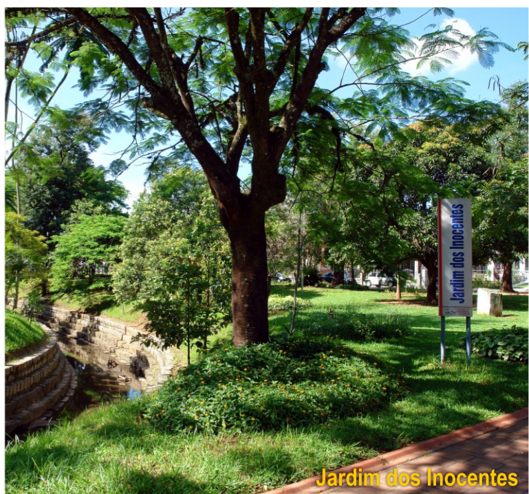
Jardim dos Inocentes