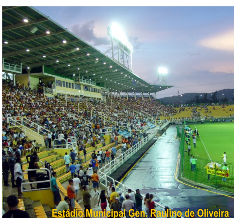
Estádio Municipal Gen. Raulino de Oliveira