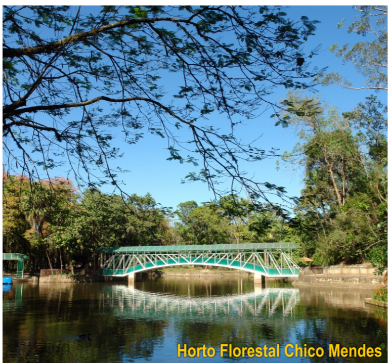
Horto Florestal Chico Mendes